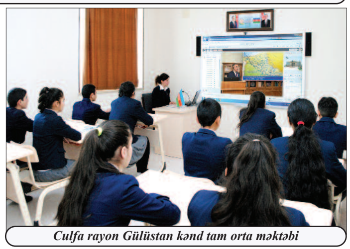
Culfa rayon Güllüstan kənd tam orta məktəbi

düşmənlərdən müdafiəsi və ərazisinin qorunub saxlanılması üçün əhəmiyyətli rol oynayıb. Bu mənada, Naxçıvanın muxtariyyət qazanması həm də tarixboyu yaranan dövlətçilik ənənələrinin davam etdirilməsinə rəvac verib. Həmin dövlətçilik ənənələrini yaşadan naxçıvanlılar 1918-1924-cü illərdə cəsarət edən daxili və xarici amillərin təsiri altında Naxçıvan Muxtar Respublikasının yaradılması üçün böyük səy göstərirlər. Əhali qədim diyarın Azərbaycanın tərkibində saxlanılması üçün istər hərbi, istərsə də siyasi-diplomatik sahələrdə fədakarlıqla mübarizə aparıb.