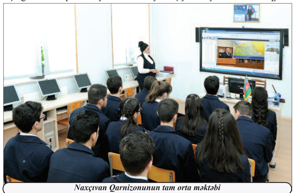
Naxçıvan Qarnizonunun tam orta məktəbi

Sədrinin rəhbərliyi ilə bölgənin üzvləşdiyi problemlər müəyyən edilərək və onların həllinə başlanılıb. İqtisadiyyatın dirçəlməsinə, əhalinin sosial-iqtisadi vəziyyətinin yaxşılaşdırılmasına xüsusi əhəmiyyət verilib, yeni iş yerləri yaradılıb. İrimiqiyahı