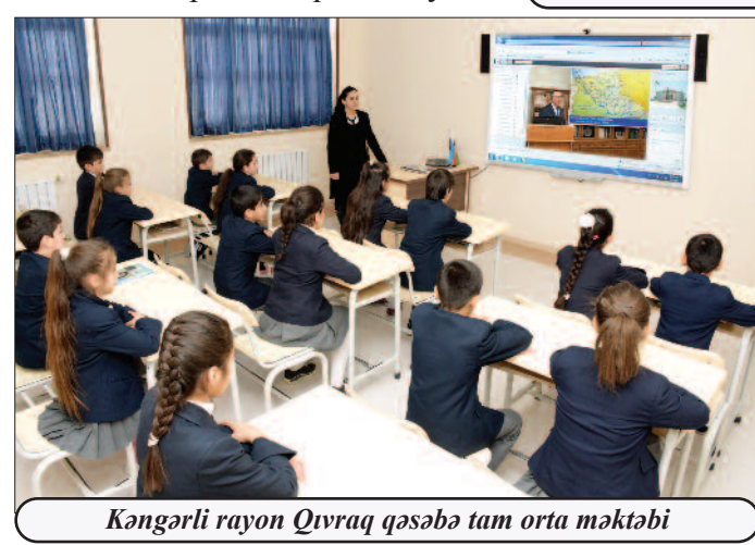
Kəngərli rayon Qıvrıq qəsəbə tam orta məktəbi